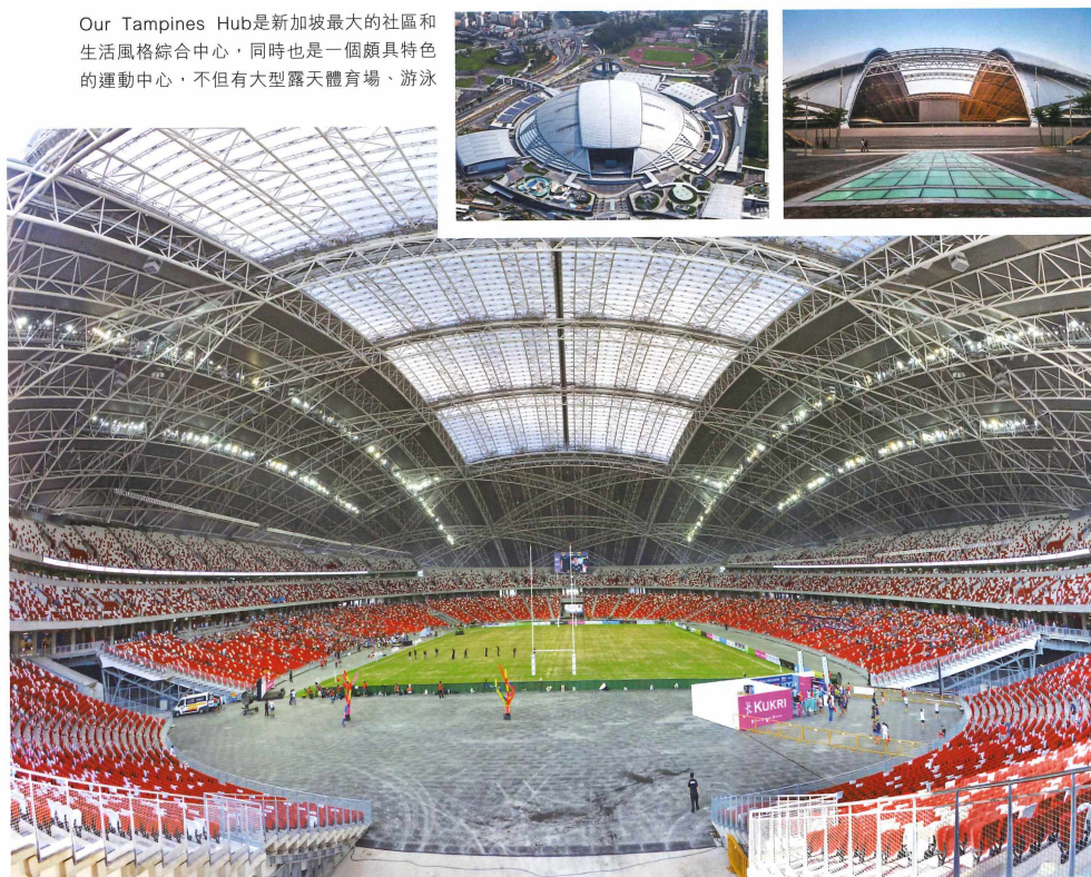
Sport Hub可供租借場地訓練。