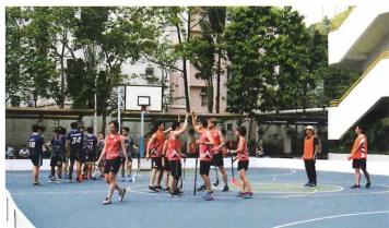
在香港的旱地冰球比賽則是借用學校籃球場舉行。