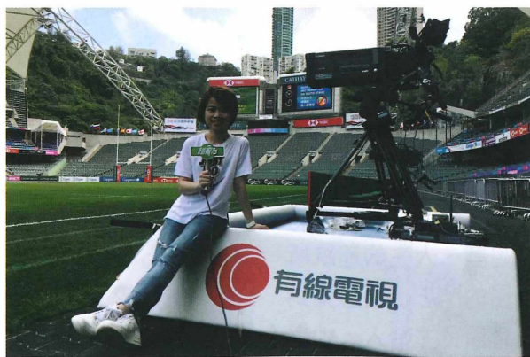
Vien認為體育與社會是分不開的，因此她在節目中能加入豐富的資訊，讓觀眾更了解身處的社會。

「運動」不但是運動員展示努力訓練成果的舞台，更是反映社會現象的一面鏡子，因為「運動」就是人類發展中不可分割的重要部分。